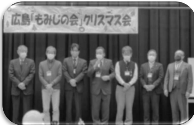
広島ロイヤルライオンズクラブ様 1年間ご支援ありがとうございました！