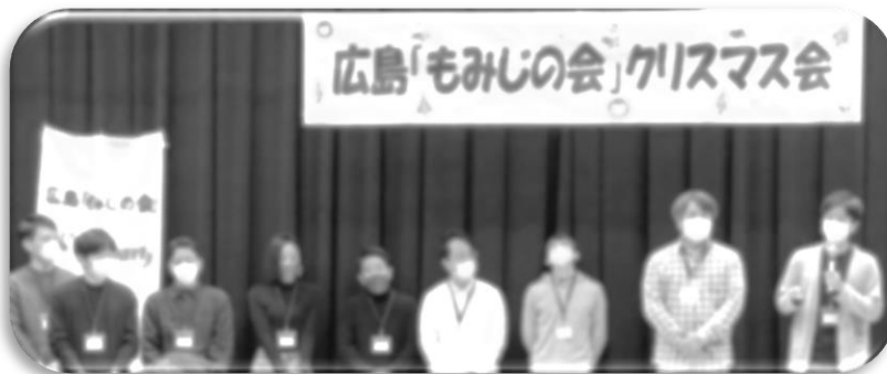
MRの皆様 ありがとうございました！