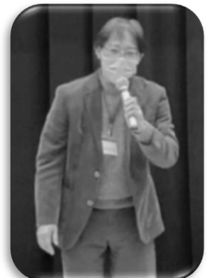
支えてくださる先生 ありがとうございました！